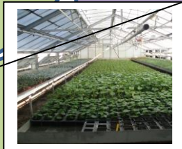
SERRE sur 1 ha